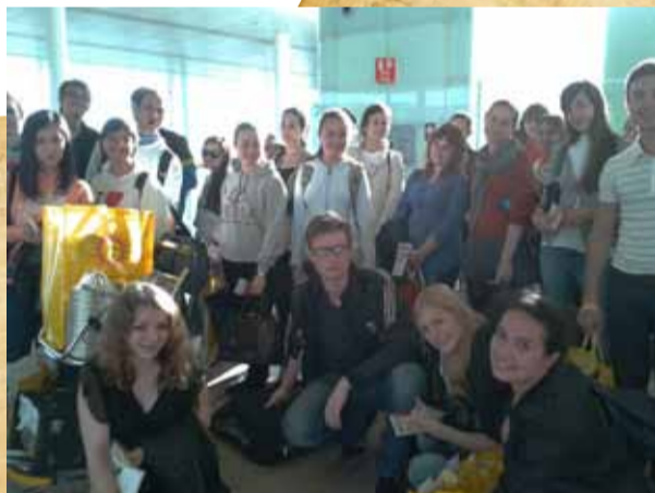
Уставшие, но счастливые в аэропорту Барселоны

Прилетев в Барселону, мы отправились в Калеллу — город на испанском побережье Средиземного моря Коста дель Маресме, который стал местом проведения международного хорового фестиваля.