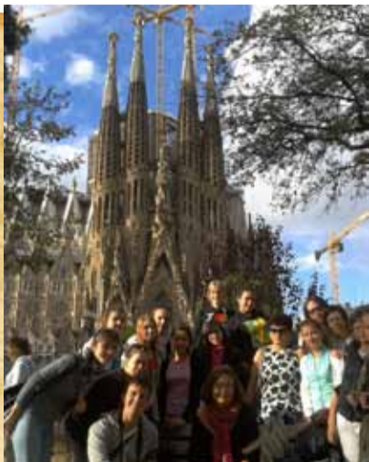
Познавательная составляющая поездки

Несмотря на успех, мы не расслабились, ведь нам предстояло выступить в ещё одной, более сложной и ответственной номинации. К тому же, новой преградой на пути была акустика кинозала «Моцарт». И здесь мы выступили достойно. Ожидание было не долгим, ведь тем же вечером состоялась церемония закрытия и оглашение результатов. И вот, этот волнующий момент: называют бронзового призера, сердце замирает на секунду, но к счастью, мы слышим название другого хора. Теперь очередь серебра, в мыслях: «Только не мы!!!», и снова награда уходит к другому коллективу... ЗОЛОТО. При первых словах: Russia. STUDENTS' CONCERT CHOIR OF THE URAL STATE MEDICAL ACADEMY мы взрываемся радостными криками, бурными аплодисментами и нашему счастью нет предела!!! Теперь мы с гордостью можем вернуться домой обладателями двух дипломов золотого уровня.