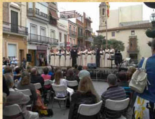
Концертное выступление под солнечным небом Испании

Второй день в Калелле. Утренняя акустическая репетиция в храмах Св. Марии и Св. Николая. Акустика этого места поражала нас своей мощностью, глубиной, фундаментальностью и идеально подходила для исполнения русской духовной музыки. Далее следовал концерт на центральной площади города, в котором приняли участие хоры из нескольких стран. Пение женского хора из Японии было настолько поразительным, что даже птицы на крышах домов вторили их голосам.