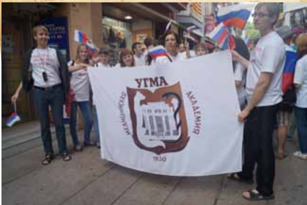
На улице Калеллы с просветительской миссией

Первый конкурсный день был ознаменован шествием хоров по улицам Калеллы и церемонией открытия фестиваля. С самого утра все участники нашего хора ознакомились с местами проведения конкурса: зал Моцарта (Категория А1 — основная номинация), храмы Св. Марии и Св. Николая (Категория S — духовная музыка), центральная городская площадь.