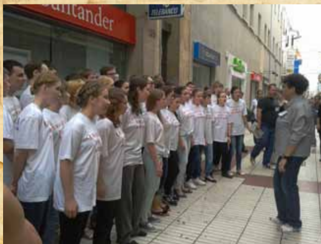
На улице Калеллы с просветительской миссией

Довольные, в отличном настроении, мы начали шествие в компании других русских хоров из Москвы, Санкт-Петербурга, Нижнего Новгорода, Красноярска,