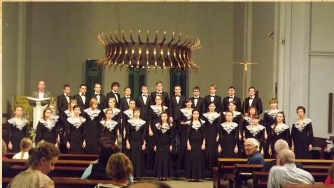
Конкурс. Духовная номинация в величественном храме