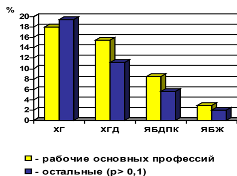
Рис. 2. Частота выявления патологии ГДС у рабочих основных профессий и остального персонала ПКЗ.