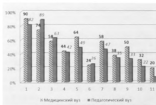
Рис. 2. Количество выборов студентами значимых характеристик образовательной среды вуза, в процентном соотношении: 1. Взаимоотношения с преподавателями, 2. Взаимоотношения с сокурсниками, 3. Эмоциональный комфорт, 4. Возможность высказать свою точку зрения, 5. Уважительное отношение к себе, 6. Сохранение личного достоинства, 7. Возможность обратиться за помощью, 8. Возможность проявлять инициативу, активность, 9. Учет личных проблем и затруднений, 10. Внимание к просьбам и предложениям, 11. Помощь в выборе собственного решения

Наименьший вклад в позитивное отношение вносит средне выраженный уровень стремления студентов к продолжению обучения в вузе как ими самими, так и их детей в будущем (поведенческий компонент отношения к вузу, ПО_{\text{пеа}}=3,37 и ПО_{\text{мед. вуз}}=3,22 ; рис. 1).