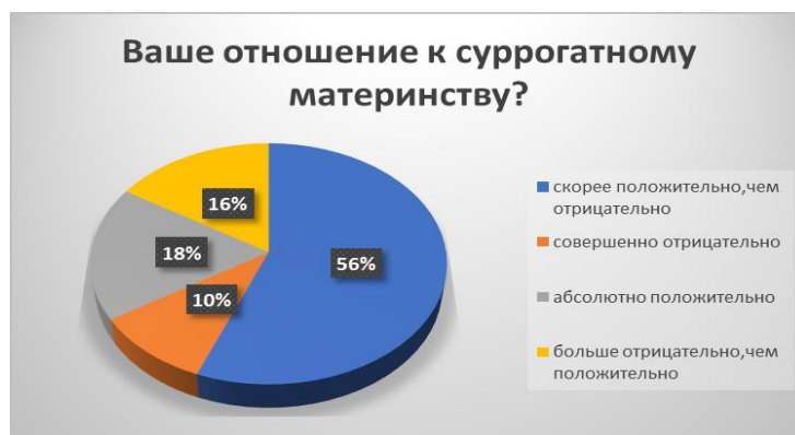
Рис.3. Вопрос №5

Также при проведении исследования был задан вопрос об отношении к суррогатному материнству в целом (Рис.3). 56% опрошенных выбрали ответ - «скорее положительно, чем отрицательно», 18 % опрошенных отметили «абсолютно положительно», также 18 % опрошенных проголосовали за «абсолютно отрицательно», 16 % опрошенных выбрали ответ - «скорее отрицательно, чем положительно». Из этого можно сделать вывод, что большинство опрошенных положительно относятся к суррогатному материнству.