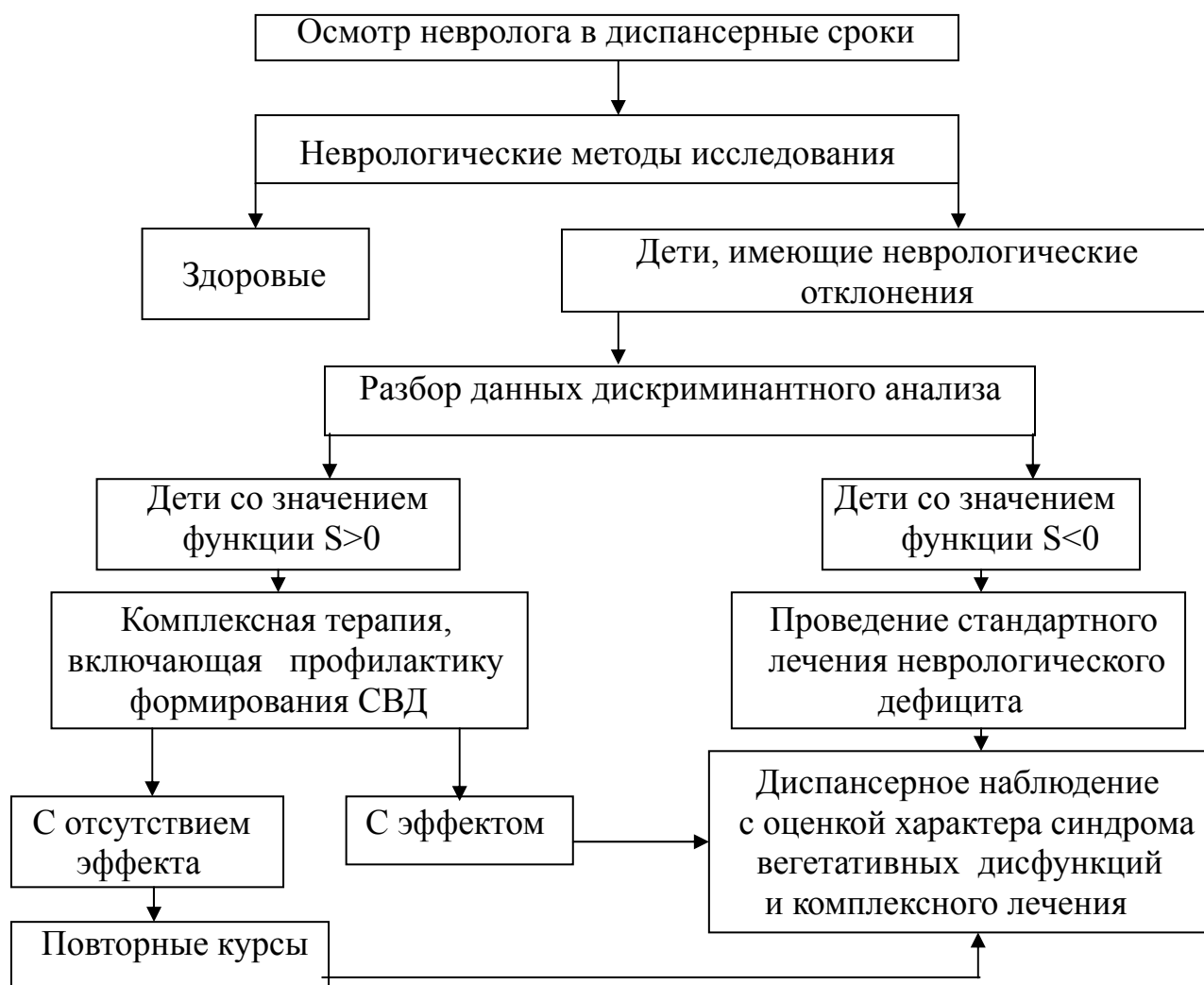
Рис. 2. Алгоритм диспансерного наблюдения детей, перенесших церебральную ишемию в периоде новорожденности

Обследование согласно предложенной методике рекомендуется применять в течение всего периода раннего детского возраста (рис. 2).