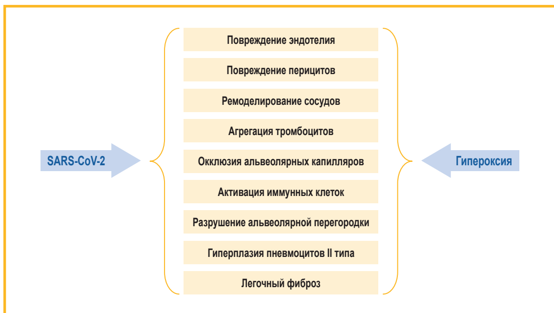
Рис. 1. Перекрывающиеся патологические эффекты при инфекции SARS-CoV-2 и воздействии гипероксии [13]

По данным 3-месячного наблюдения за пациентами, перенесшими НКИ различной степени тяжести