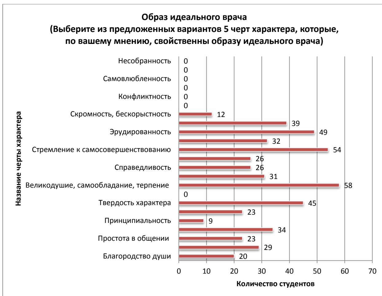
Рис.1. Результаты первого вопроса анкетирования «Образ идеального врача»

В итоге, для большинства студентов медицинского университета идеал настоящего врача-профессионала – это человек, обладающий моральными качествами, который постоянно развивается и совершенствуется. В реальности, по мнению опрошенных, врач предстает как корыстный человек, неспособный понять другого человека и помочь ему.