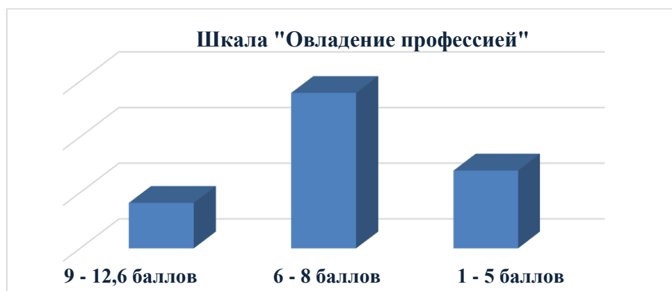
Рис.2. Результаты по второй шкале «Овладение профессией»

Данные по второй шкале «Овладение профессией» получились следующими: высокие баллы набрали 16,3% респондентов; средние баллы у 55,8%; низкие у 27,9% соответственно.