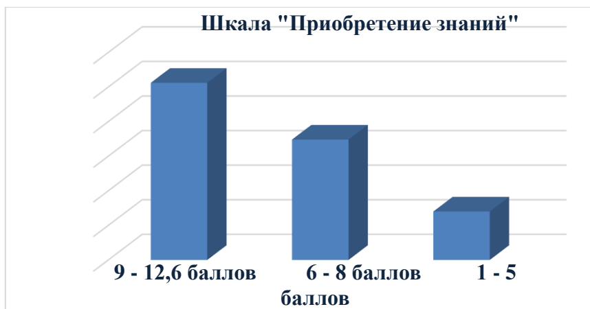
Рис.1. Результаты по первой шкале «Приобретение знаний»

Анализ анкетирования показал следующие результаты. По первой шкале «Приобретение знаний» 51,2% респондентов набрали высокие баллы от 9 до 12,6; средние баллы от 6 до 8 набрали 34,8% респондентов; низкие баллы – 14%.