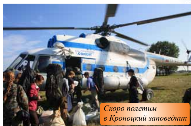
Скоро полетим в Кроноцкий заповедник