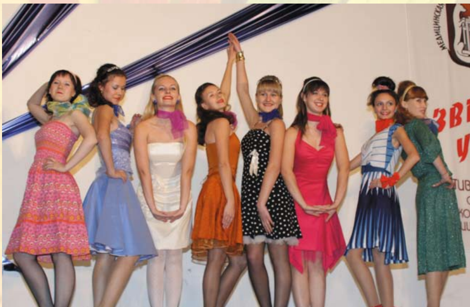
Девушки фармацевтического факультета придали особую атмосферу вечеру своим озорным номером

В этом конкурсе было, пожалуй, сложнее всего определить победителя. Выступающих было много, различные танцевальные жанры были представлены: