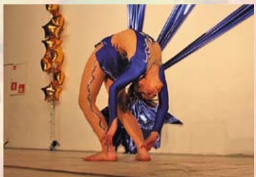
Великолепный акробатический номер