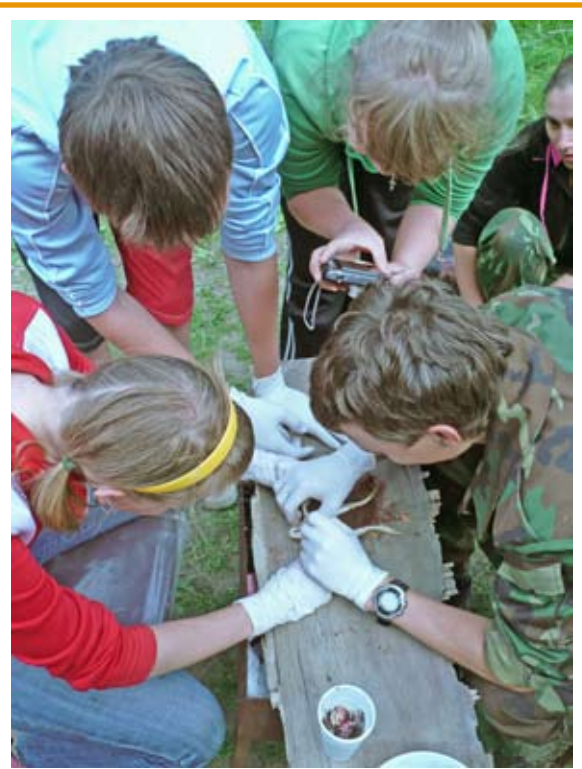
Студенты-медики демонстрируют свои знания геологам. Операция "Лягушка"

На этом наши приключения не закончились. Приходилось сталкиваться и с более серьезными ситуациями. В период цветения растений один студент страдал тяжелым приступом аллергии. Мы стали для него спасением. К концу практики все немного устали, что также не могло не сказаться на самочувствии.