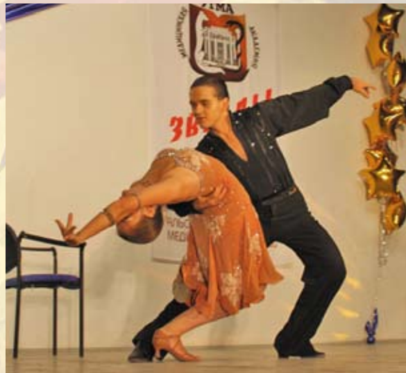
Бальный танец. В нем соединились искусство и спорт благодаря четко выверенным движениям партнеров (ребята танцевали Румбу — зажигательный чувственный танец)