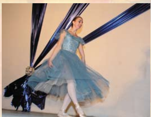
Классический танец-балет — безусловно, высшая форма хореографии, за несколько минут зритель стал участником целого музыкально-театрального представления