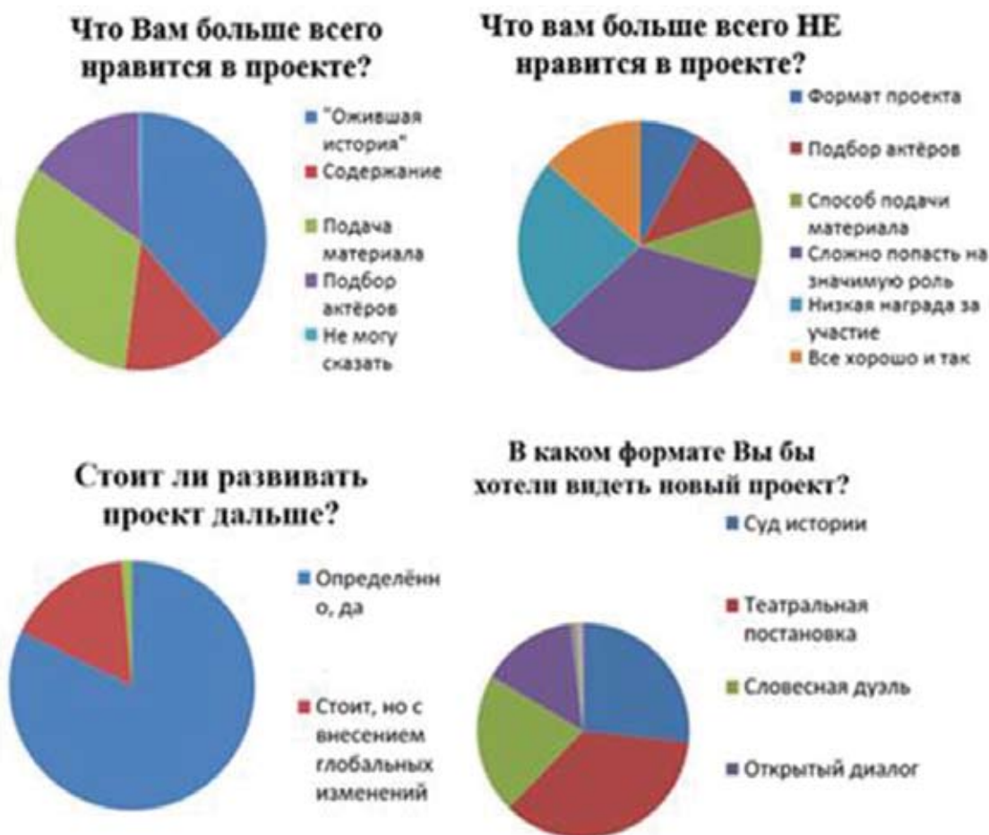
Рис. 2. Критика и оценка перспектив развития проекта «К барьеру» участниками [3]

Одним из основных вопросов является вопрос о целесообразности продолжения проекта. Из 216 опрошенных только шесть человек решили, что проект уже изжил себя и реализовывать его больше не стоит. Оставшиеся респонденты уверены, что проект нужен и должен продолжать свое существование, но шестая часть из них предлагают внести различные изменения в формат проведения мероприятия. Каким же хотят видеть проект участники и зрители в будущем? Большая часть опрошиваемых желает увидеть историческую театральную постановку. Четверть анкетированных считает, что наилучшим развитием проекта станет его трансформация в «суд истории». Примерно такое же количество респондентов вообще не видят необходимости менять действующий формат проекта, предлагая сохранить словесную дуэль. Седьмая часть опрошиваемых предложила форму открытого диалога для увеличения количества задействованных людей в мероприятии (рис. 2).