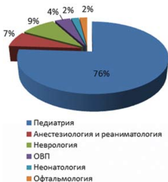
Рис. 1. Специалисты, принявшие участие в реализации программы «Паллиативная помощь в педиатрии»