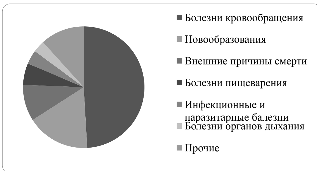
Рис.2 Структура причин смертности населения

Структура причин смерти населения на протяжении 4 лет (2014-2017гг.) остаётся неизменной (рис.2), на первом месте остаются болезни кровообращения, на втором - опухоли, на третьем - травматизм и другие причины.