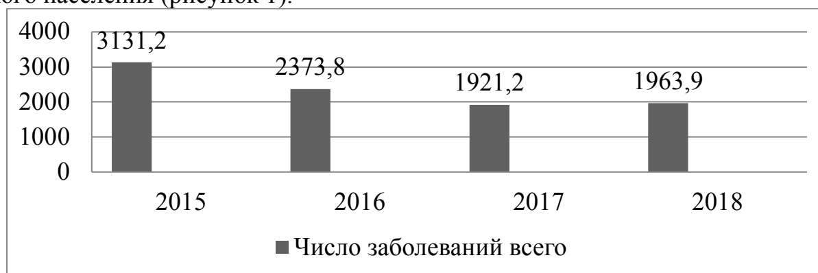
Рис. 1. Динамика острой заболеваемости детей в ДООУ (на 1000 детей)

Динамика острой заболеваемости в дошкольном образовательном учреждении среди детей 3 – 6 лет за 3 года характеризуется тенденцией к снижению. Наибольшая заболеваемость была зарегистрирована в 2015 году, составила 3131,2 случаев на 1000 детей, и каждый ребенок болел до 3 раз в год. С 2016 года отмечается снижение заболеваемости детей до 2373,8 на 1000 детей, и к 2017 году до 1921,2 на 1000 детей. В 2018 году произошел незначительный подъем заболеваемости до 1963,9 случаев заболеваний на 1000 детского населения (рисунок 1).