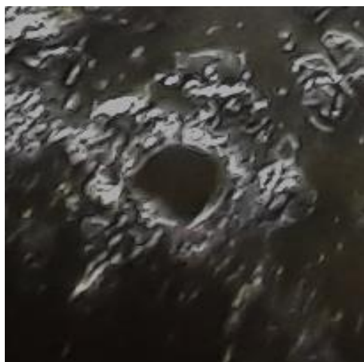
Рис.2. МПРЖ пациентов первой группы – 5-й тип микрокристаллизации.

Анализ МПРЖ [2,3] пациентов показал, что в 88,24\% \pm 4,24\% в первой группе (с ЖДА) преобладал 5-й тип микрокристаллизации – практически полное отсутствие кристаллов, деструктуризация ротовой жидкости, что подтверждает наличие ксеростомии второй степени (рис.2).