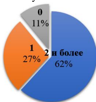
Рис. 2 - Диагностика частоты участия волонтеров в мероприятиях проекта «Счастливая улыбка» в 2019 году.

Среди опрошенных, 97% волонтеров оценивают уровень проводимых мероприятий как высокий. Около 98% студентов хотят продолжать участие в реализации проекта «Счастливая улыбка».