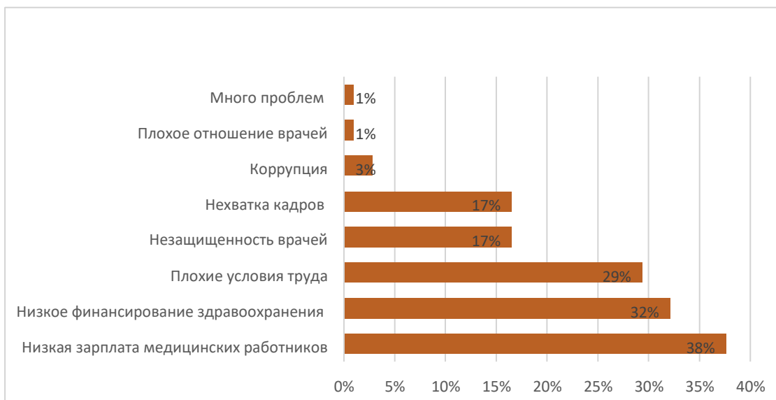
Рис. 2. Основные проблемы в системе здравоохранения

Основной целью нашей работы является выявление проблем в системе здравоохранения по мнению студентов в настоящее время.