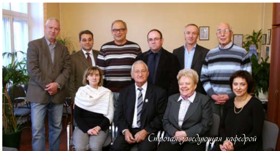
Строгая заведующая кафедрой

оригинальное и вкусное блюдо. Признает, что умение таким образом выстроить свою работу, чтобы оставалось время и на отдых, приходит с годами.