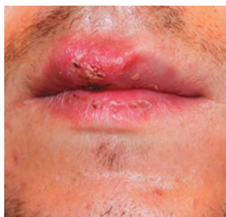
Рис. 3. Больной первичным сифилисом. Твердый шанкр в области верхней губы.

Fig. 2. The patient after suffering a Fournier's gangrene. Plastic of the scrotum, penis, perineum a free perforated cutaneous flap from the thigh.