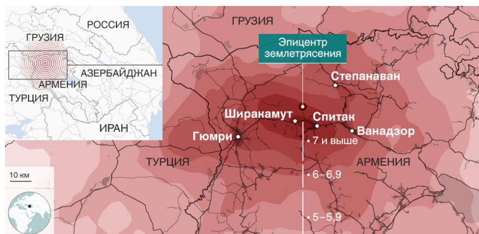
Рис. 1. Распределение интенсивности землетрясения

Впоследствии Ереванский горком партии и райкомы города мобилизовали 12 000 человек, которые были отправлены в наиболее пострадавшие от землетрясения города. Вместе с тем, в зону катастрофы были направлены сотни бульдозеров, кранов, экскаваторов и других автомашин [11].