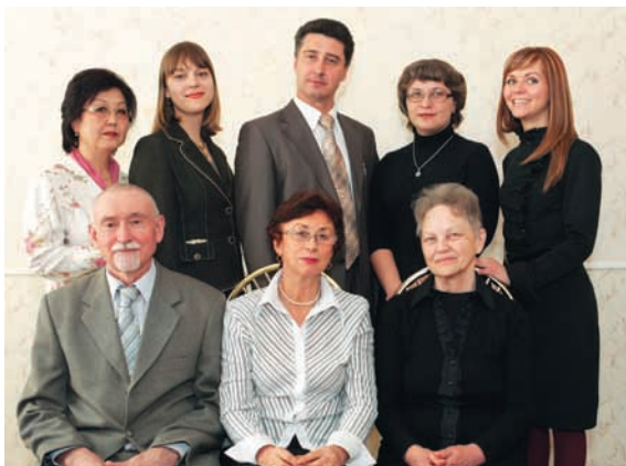
Коллектив кафедры эпидемиологии