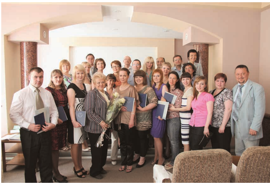
Первый выпуск на кафедре «Социальная работа»