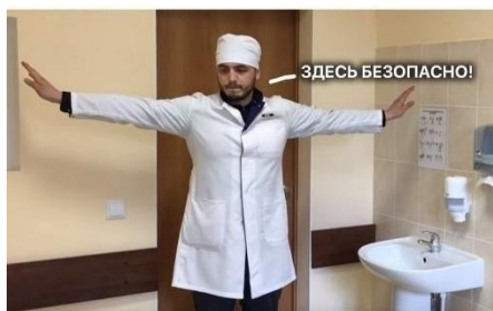
Fig. 2. Creolised text №2

The student's expectation ('quickly read anatomy and go to bed') turns into reality, where he has to study the anatomy textbook by the author M.G. Prives until morning. To reinforce the verbal component, a blurred picture of a ruffled kitten is used, which emphasises the medical student's fatigue and inexperience in the allocation of study time. This creolised text possesses full creolisation.