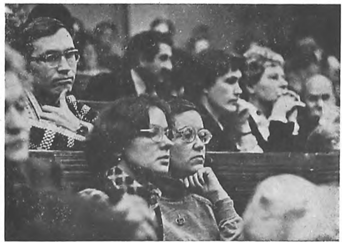
НА ПАРТИЙНОМ СОБРАНИИ.

ным рабочим планам. Однако мы недостаточно внедряем принципы интегрирования, не можем похвалиться межкафедральными комплексными программами, разработанными кафедральными коллективами и прошедшими апробацию на уровне Министерства здравоохранения РСФСР. Мало активны в этом отношении цикловые методические комиссии по терапии, хирургии, теоретических и медико-биологических дисциплин, методические советы факультетов.