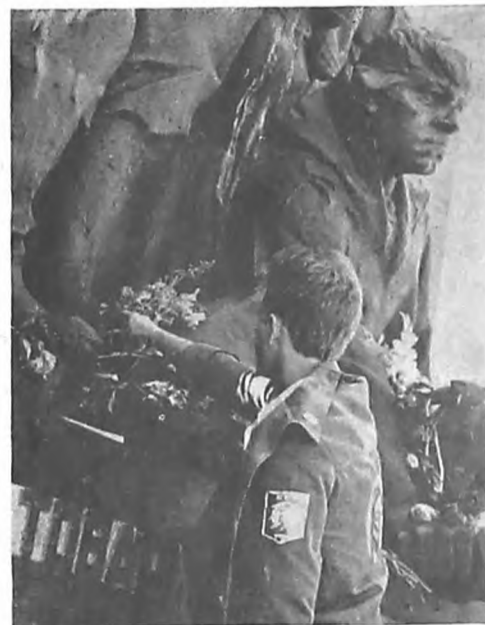
На снимке: чья светлую память.