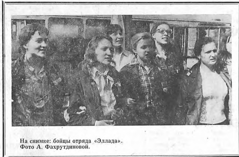
На снимке: бойцы отряда «Эллада».

Как и на целине, так и в подготовительный период дел хватает всем. Но мы умеем и отдыхать. Много у нас друзей — других строительных отрядов, сложились свои традиции. Работают в отряде много и интересно агитбригада,