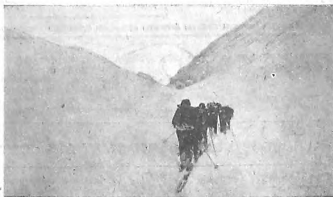
Отряд уходит в горы...

тавы. Впервые встали на лыжи. Ли — первая ночь, проведенная в Близке к вечеру остановились на лесу. Ночью чувствовалось стыночлеж. Расположились, поужинали, нущее дыхание Севера.