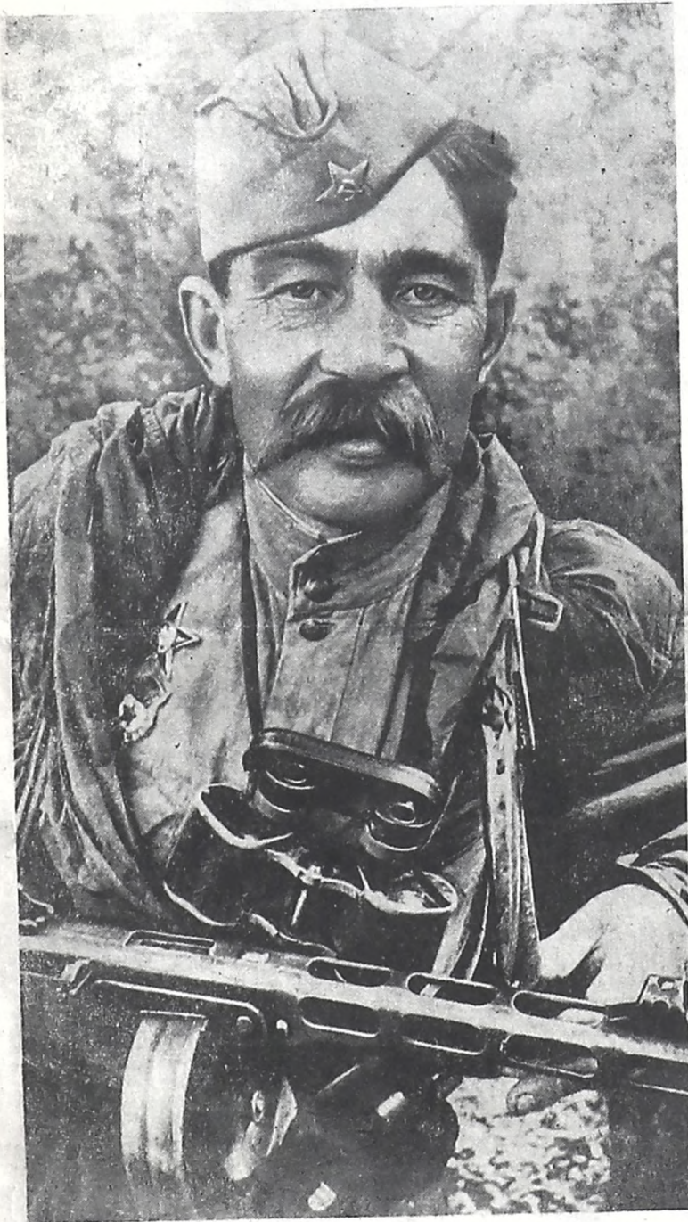
МЫ ПРОШЛИ ОТ ВОЛГИ ДО БЕРЛИНА!