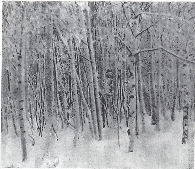
Родные березы мои...