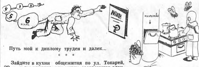
Путь мой к диплому труден и далек...