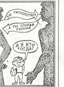
Рис. О. Зеленцова, врач ОКБ № 1.