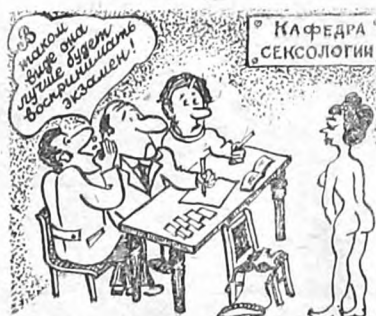
Рис. О. Зеленцова, врача.