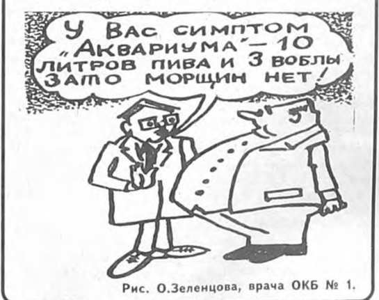
Рис. О.Зеленцова, врача ОКБ № 1.