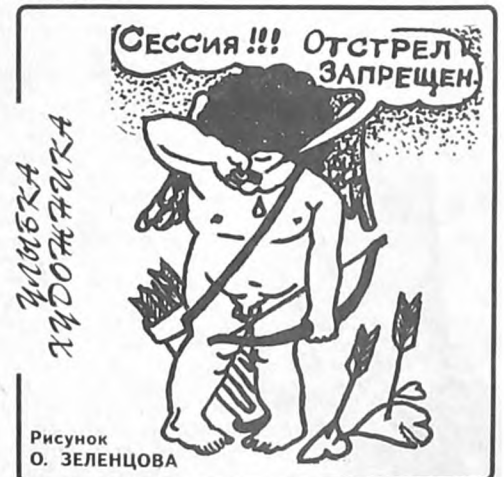
Рисунок О. ЗЕЛЕНЦОВА

— Большой! Таблетку с рисковой посредне Сломайте пополам и — нет вопроса. Примите: половинку от ангины, Другую половинку... от поноса.