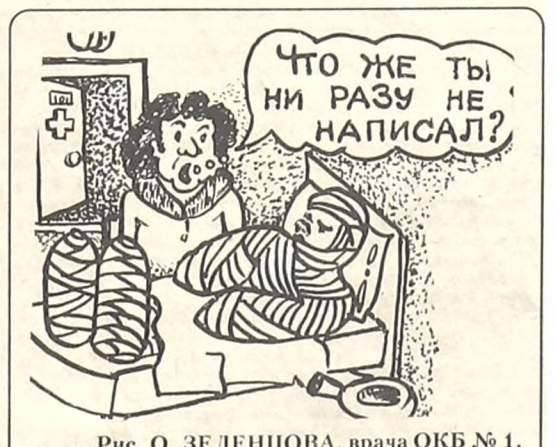
Рис. О. ЗЕЛЕНЦОВА, врача ОКБ № 1.