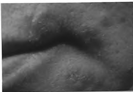
Рис. 3. Пациентка М., 52 год.