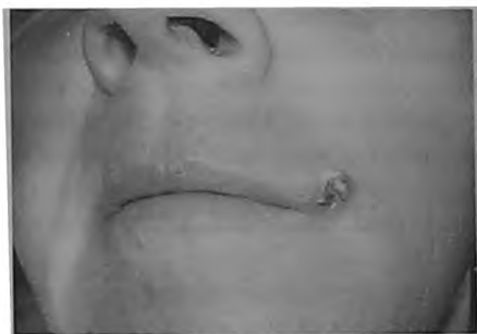
Рис. 1. Пациентка А., 51 год