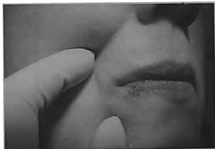
Рис. 2. Пациентка О., 43 года