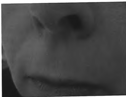
Рис. 4. Пациентка У., 48 лет

Несмотря на высокую инфицированность населения вирусом простого герпеса, манифестные формы течения заболевания наблюдаются не у всех пациентов. У большинства носителей