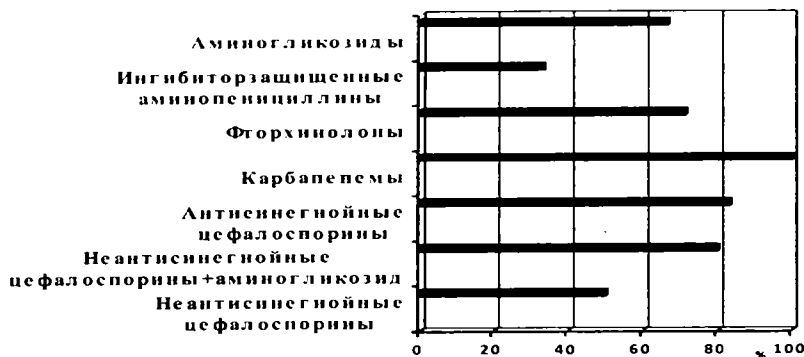
Рис. 3. Эффективность имперической антибактериальной терапии простатита на фоне ВИЧ - инфекции

тита на фоне ВИЧ-инфекции демонстрирую лишь препараты и схемы, имеющие максимально широкий спектр антибактериальной активности.