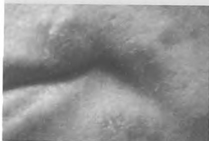
Рис.4. Пациентка М., 52 года.