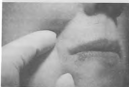
Рис.3. Пациентка О., 43 года.