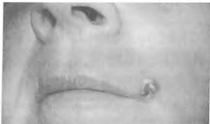
Рис.1. Пациентка А., 51 год.