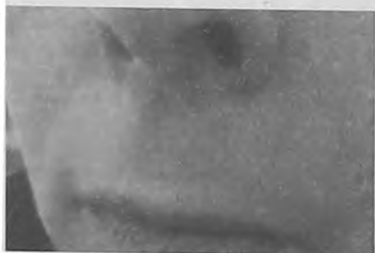
Рис.5. Пациентка У., 48 лет.

АДА и ИДА свидетельствуют о том, что у пациентов с возникновением рецидива герпетической инфекции более 2-х раз в год в анамнезе при постановке анестезии в 75% случаев вновь развиваются клинические проявления заболевания [3, 4].