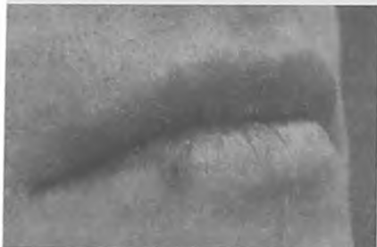
Рис.2. Пациент С., 28 лет.