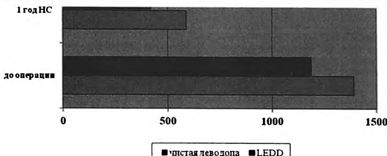
Рисунок 3. Динамика LEDD и дозы леводопы (мг/сут) до операции и через 1 год на фоне НС.

гидности – на 40,7%, гипокинезии – на 30,8%, а также отмечалось улучшение ходьбы на 22,3% ( p < 0,005 ).