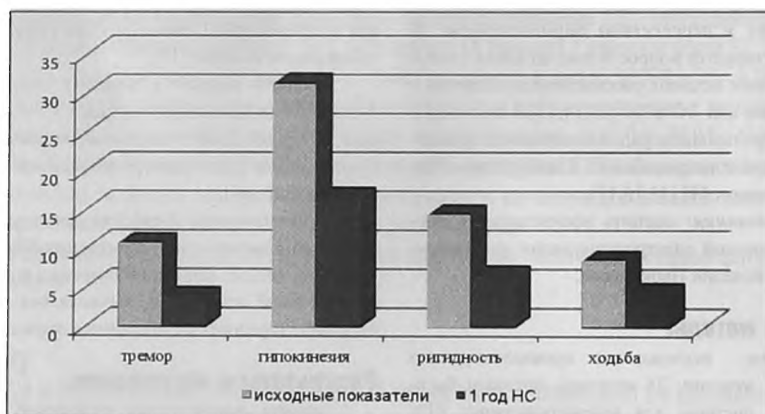
Рисунок 1. Динамика основных двигательных симптомов по шкале UPDRS в OFF-периоде на фоне ЭС STN. *- p \leq 0,05