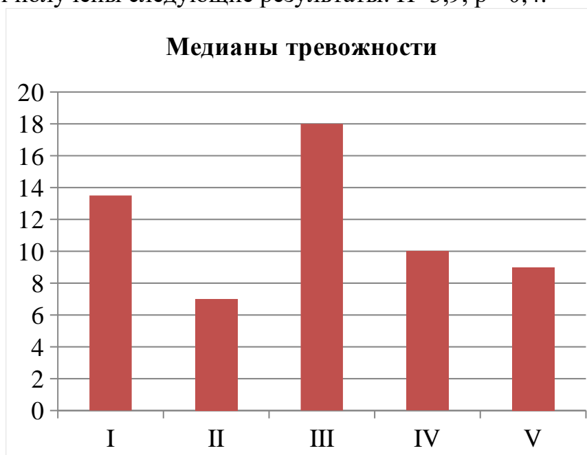
Рис. 1 Распределение результатов опросника «Шкала тревожности студента» между курсами, баллов

При обработке данных полученных после проведения опросника были посчитаны медианы баллов тревожности по каждому курсу (Рис. 1). При проверке на нормальность распределения критерием W-Шапиро-Уилка, было выявлено, что полученные данные не совпадают с ожидаемыми для данной выборки ( W=0,9 , p=0,005 ), вследствие чего дальнейшая статистическая обработка проходила по критерию Н-Краскала-Уоллеса. После обработки критерием были получены следующие результаты: H=3,9 , p=0,4 .