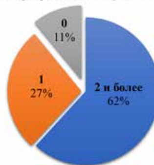
Рис. 2. Диагностика частоты участия волонтеров в мероприятиях проекта «Счастливая улыбка» в 2018 году

В скольких мероприятиях вы участвовали за 2018 год?