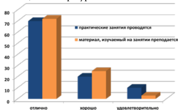
Рис. 2. Оценка практических занятий и изучаемого материала на кафедре

В целом учебный процесс на кафедре удовлетворяет требованиям основных потребителей — студентов. При этом обучение на кафедре продолжает совершенствоваться и адаптироваться к требованиям рынка труда. Сотрудники кафедры используют методы оценки системы качества. Проводится постоянное улучшение имеющихся и внедрение новых форм учебно-методической деятельности: балльно-рейтинговая система оценки знаний, учебные истории болезни, фото и видеоматериалы, постоянное обновление тестовых контролей, разрабатываются новые учебные и методические пособия в дополнение к имеющейся литературе.