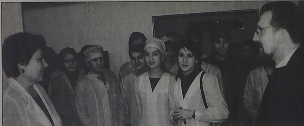
На снимке: встреча с художником и его творчеством.