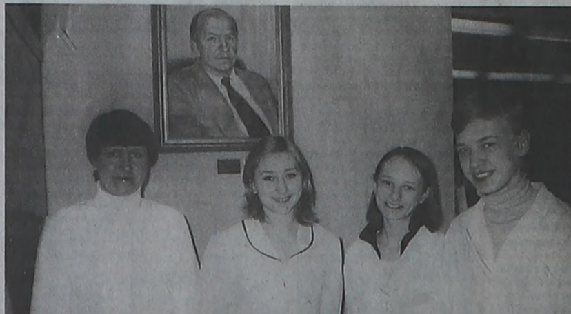
На снимках: во время встречи в музее истории медакадемии.

● Изучая курс истории медицины, студенты часто готовят интересные рефераты. В год 60-летия Победы в Великой Отечественной войне эти работы посвящаются деятельности медиков на фронте и в тылу.