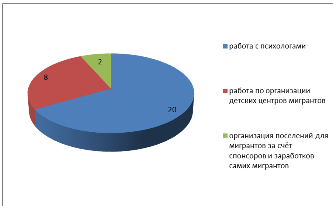
Рис. 3. Потенциальные направления социальной работы с мигрантами, выделенные волонтерами

Таким образом, письменный и устный опрос волонтеров показал, что в целом, они считают социальную работу организаций типа CADA в области социальной адаптации и интеграции беженцев на территории Франции эффективной. Большинство респондентов отмечает, что усиление лояльности будет расслаблять беженцев и уменьшать стремление работать и становиться работоспособными и образованными членами французского общества.