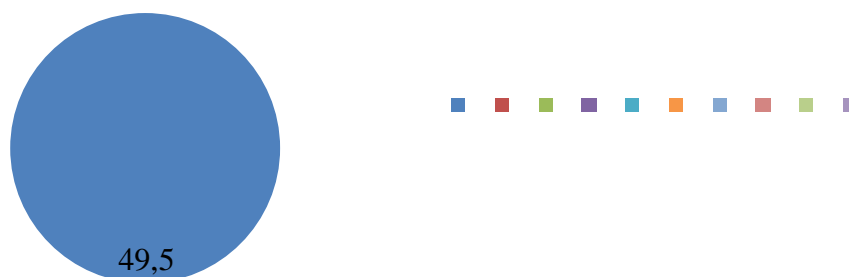
Рис.3. Способы суицидальных попыток среди лиц женского пола, %

На круговой диаграмме (рис. 2) представлены данные о способах суицидальных попыток. Среди мужчин преобладают такие способы совершения суицида как самопорезы – 44,6% случаев, или 97 человек ( \chi^2_{\text{эмп.}}=8,042 , p<0,01 ), и самоповешение – 37,9% случаев, или 83 человека ( \chi^2_{\text{эмп.}}=29,696 , p<0,01 ). Что свидетельствует о склонности мужчин прибегать к более агрессивным способам суицида с высокой вероятностью летального исхода.