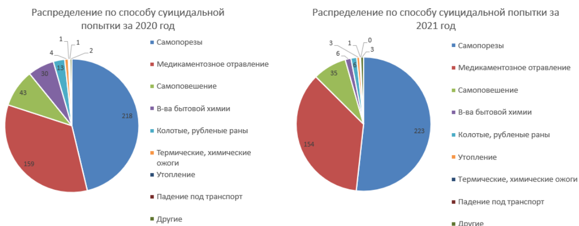
Рис. 2. Распределение по способу суицидальной попытки за 2020-2021 гг.

На рисунке 1 мы видим, что повторные попытки суицида наиболее часто совершаются в молодом возрасте (от 18 до 44 лет по ВОЗ). Также мы можем отметить высокие показатели повторных попыток суицида в подростковом возрасте в 2020 году – 119 попыток (25,8%), в 2021 - 94 попытки (23,0%).