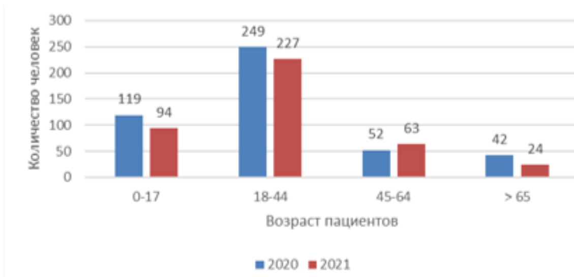
Рис.1. Распределения по возрасту среди повторных попыток суицида за 2020-2021 гг.

На рисунке 1 мы видим, что повторные попытки суицида наиболее часто совершаются в молодом возрасте (от 18 до 44 лет по ВОЗ). Также мы можем отметить высокие показатели повторных попыток суицида в подростковом возрасте в 2020 году – 119 попыток (25,8%), в 2021 - 94 попытки (23,0%).