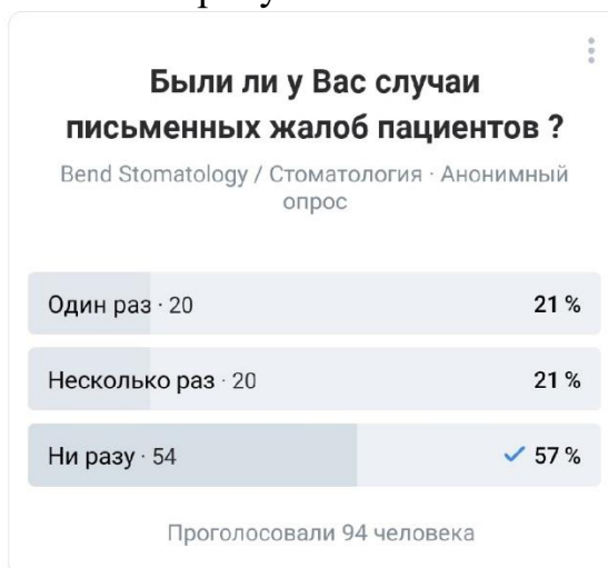
Рис. 4 Результаты опроса 1

При обработке результатов анкетирования среди врачей УГМУ выяснилось, что каждый из врачей со стажем работы более 5 лет хотя бы раз сталкивался с этой неприятной ситуацией. Этот же вопрос был задан участникам сообщества «Bend Stomatology» в социальной сети «ВКонтакте». Результаты опроса представлены на рисунке 1.