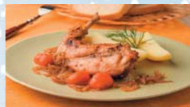
«Тушеный кролик с картошкой»

В XXI веке на праздничном столе вновь изобилие блюд, порой даже сложно выбрать лучшее из великого множества рецептов. Чтобы облегчить задачу, предлагаем вашему вниманию рубрику «Кулинарные рецепты».